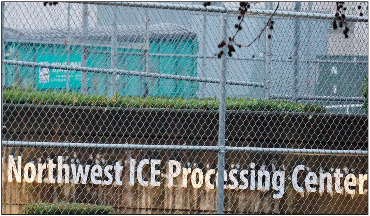
Centro de Detención en Tacoma

El propio ICE ha reportado un aumento en operativos recientes, lo que ha intensificado el debate sobre políticas migratorias y derechos de los detenidos.