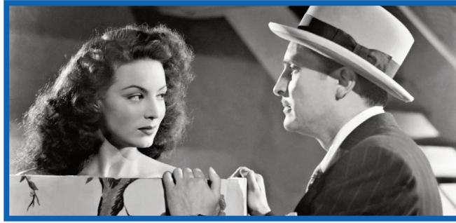
María Félix y Arturo de Córdova en la cinta "La Diosa Arrodillada".

En ese contexto de homenaje y recuerdo, traemos para ti una selección especial de películas protagonizadas por