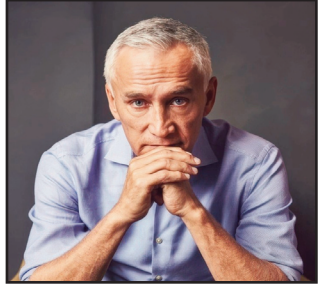
JORGERAMOS Así Veo Las Cosas

La columna es mi columna. Escribir esta columna es, posiblemente, la actividad más constante que he tenido en toda mi vida, luego de ser padre.