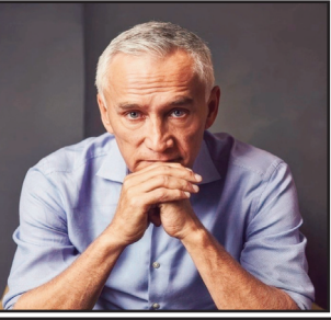
JORGERAMOS Así Veo Las Cosas

Es un gran error ponerse a la defensiva cuando se trata de narcos y desaparecidos. El gobierno de México debería aprovechar esta oportunidad para tomar el lado de las víctimas y no el de los matones y corruptos. En lugar de tildar como "político" el objetivo de quienes acusan de fuertes vínculos con el narcotráfico a 10 funcionarios mexicanos de MORENA -y de "tendencioso" el reporte de expertos de la ONU sobre las decenas de miles de desaparecidos en México- la actitud correcta sería agradecer la información y perseguir juntos a los responsables de crímenes, no defender automáticamente a los acusados solo por ser miembros del partido en el poder.