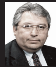
MI PUNTO DE VISTA

Las medidas para ahorrar energía pueden ayudar a aliviar la presión inmediata sobre los hogares, pero no sustituyen la necesidad de políticas públicas más sólidas que amplíen la asistencia energética, fortalezcan la infraestructura y protejan a las comunidades más vulnerables. Porque cuando sobrevivir al calor depende del tamaño de la factura eléctrica, la desigualdad también se convierte en un riesgo de vida o muerte.