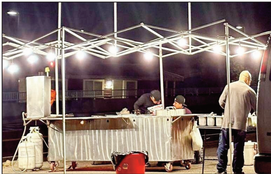
Cortes a del Departamento de Salud de