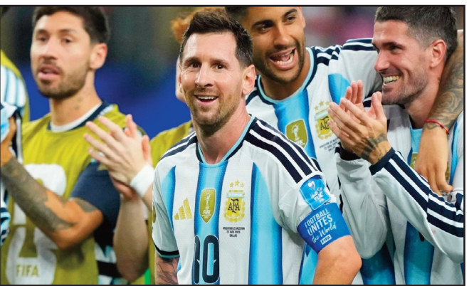
La sonrisa de Messi, autor de cinco goles en dos partidos.

ARGENTINA - Lionel Messi afirmó estar "feliz" y también "cansado" este lunes al final del partido que Argentina ganó por 2-0 ante Austria y en el que el '10' hizo historia con dos goles para convertirse, con 18 tantos, en el máximo artillero de los mundiales.