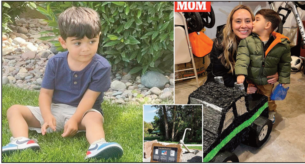
La madre, enfermera del hospital donde fue trasladado, presenció su llegada en ambulancia.