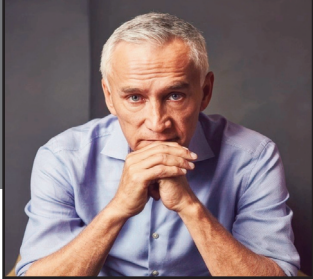
JORGERAMOS Así Veo Las Cosas

“Se ve medio tristón”, me comentó mi amigo Jimmy sobre el ambiente mundialista en Estados Unidos. Estábamos saliendo del aeropuerto y no me tocó ver ninguna señal de que el torneo más importante del planeta se estuviera realizando aquí. Quizás es que salí por la puerta equivocada, que estamos en medio de una injustificada guerra contra Irán, que hay que andar volteando a todos lados por si se aparecen los agentes encapuchados de ICE o que, después de todo, este país no es tan futbolero como México.