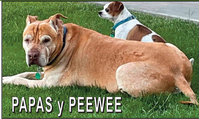
PAPAS y PEEWEE

"Una posible explicación es que, dado que las interacciones con los gatos suelen ser más pasivas y menos exigentes, un mayor nivel de interacción podría resultar más emotivo. Esto podría no coincidir con la necesidad de apoyo en momentos de estrés", explicó por su parte