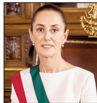
La presidenta de México, Claudia Sheinbaum

Sheinbaum sostuvo que es necesario aclarar cómo ocurrió el operativo y determinar si existió participación directa de agencias estadounidenses en territorio mexicano, pese a que