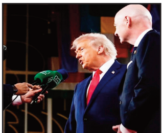
El presidente Donald Trump y el presidente de la FIFA, Gianni Infantino.