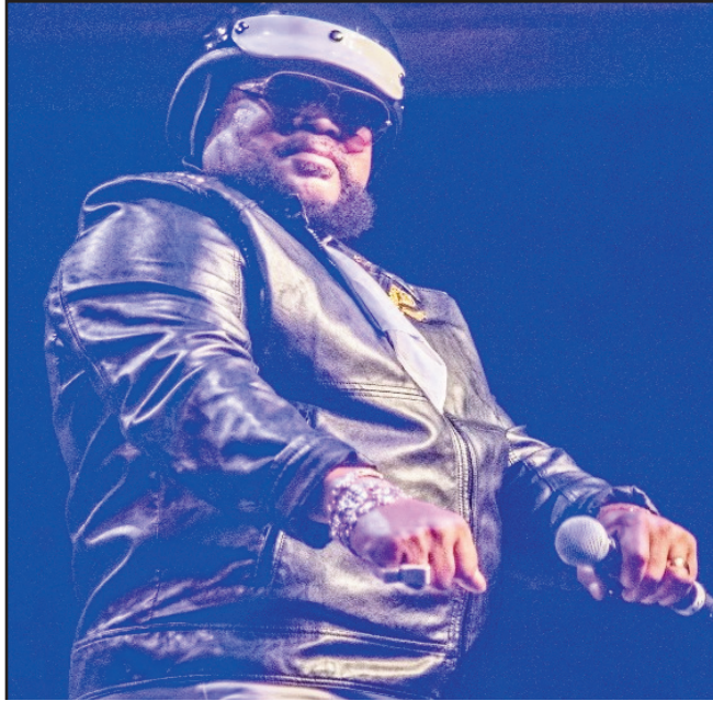
Victor Willis falleció a los 74 años.

Junto a Felipe Rose, Alex Briley, David Hodo, Glenn Hughes y Randy Jones, impusieron moda al usar como vestuario en sus presentaciones disfraces de estereotipos masculinos, incluyendo